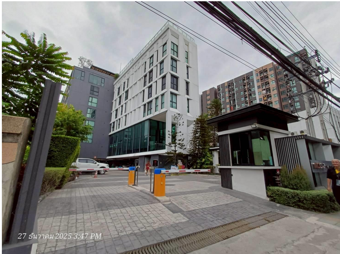
รูปที่ 1-3 ภาพปัจจุบันของโครงการ

ปัจจุบันโครงการอยู่ในช่วงเปิดดำเนินการ และได้รับใบรับรองการก่อสร้าง(อ.6)เรียบร้อยแล้ว ดังแสดงใน ภาคผนวก ก-3